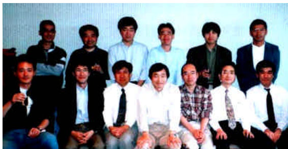
関東支部交流会にて(4月29日 ホテルセンチュリーサザンタワー)

乾杯後には各自の近況報告と「20周年で何をやるか?」を中心に同窓会設立20周年記念事業についての希望や意見を1人ずつスピーチしました。「岩大の中を歩いてみたい」「退官した先生を呼んで講義してもらおう」「先生よりも集まった人たちが(同窓生)の話を聞くほうがいい」等々の意見がありました。...これらの意見は、6月3日(土)に開催された(定例)評議員会に持ち越され、討議・検討されました。