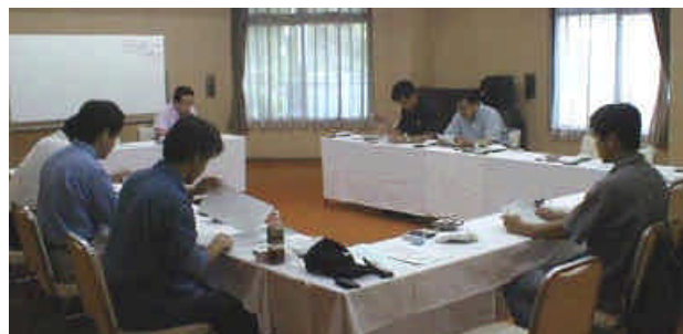
平成12年度評議員会にて (6月3日 ホテル三春)